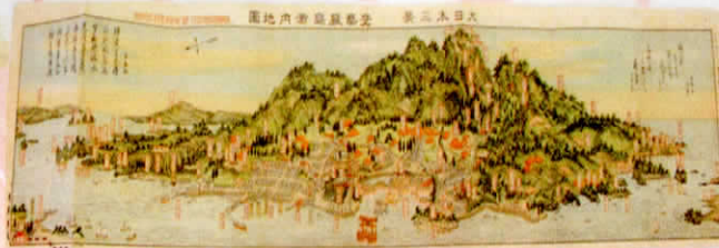
日本三景ノ一厳島案内地図 附名所案内記 (瀬田春錦堂)