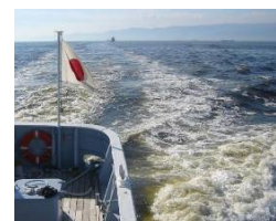
Fig. 2 播磨灘・大阪湾の瀬戸内海区水産研究所所属漁業調査船「しらふじ丸」調査