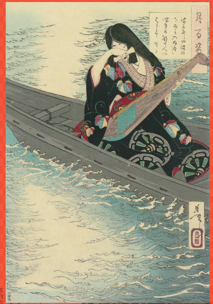
月百姿有子 月岡芳年 県立広島大学宮島学センター蔵