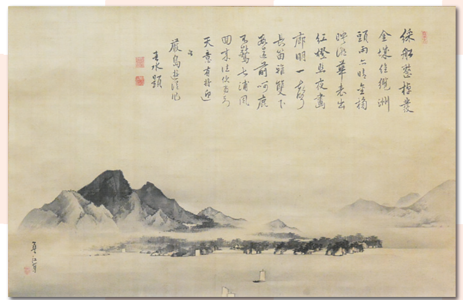
厳島図 中井蘭江筆・頼春水賛 個人蔵(当館寄託)