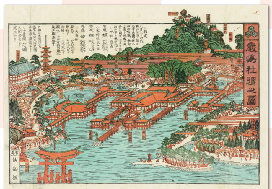
厳島社頭図 木版本 県立広島大学宮島学センター蔵