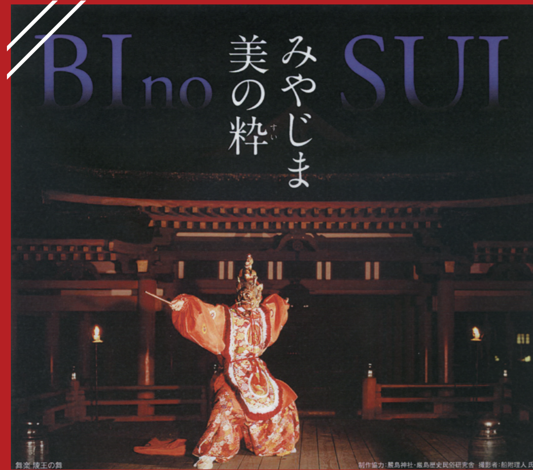
舞臺 綾王の舞 制作協力：厳島神社・広島歴史民俗研究会