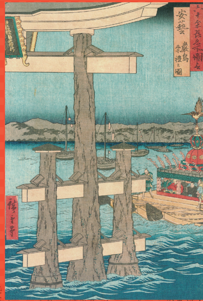
六十余州名所図会 安芸厳島祭禮之圖 歌川広重 県立広島大学宮島学センター蔵