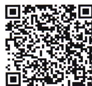
看護学科ホームページ QRコード