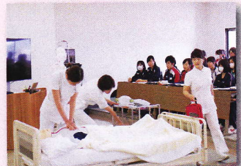
教員が行うデモンストレーション

看護学科マスコットキャラクター「ナースだるま・しまなみ」です！看護学科についてもっと知りたい場合はぜひホームページ（県立広島大学トップ→保健福祉学部→看護学科）をご覧ください。学生や教員の活動を紹介する記事をたくさんアップしていますよ！