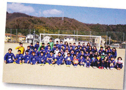
サッカーサークル 卒業する先輩達と一緒に記念撮影しました。