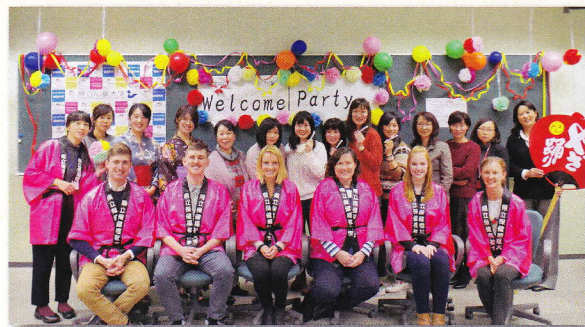
歓迎会の記念写真