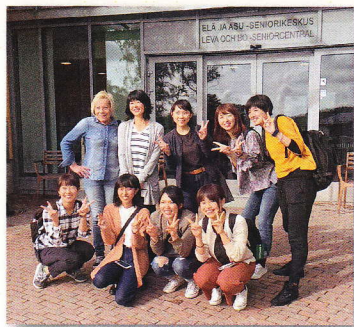
フィンランドの老健施設の前で

海外の医療・看護事情を学修します。 平成29年度は看護学生8名がフィンランドでの短期研修に参加し、キャンベラ大学（豪）からは5名の看護学生を迎えて交流しました。