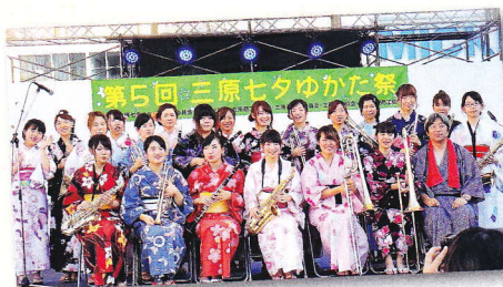
吹奏楽サークル 三原七夕ゆかた祭に毎年出演しています。

陸上、サッカー、バスケットボール、バレーボール、バドミントン、硬式テニス部、吹奏楽、茶道・華道、軽音楽、ダンスなど、数多くの体育系、文化系サークルがあり、多くの看護学科の学生が活躍しています。