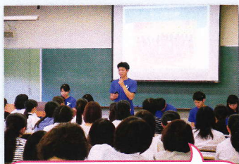
学生によるプレゼンテーションを行います。ぜひオープンキャンパスにご来場ください！