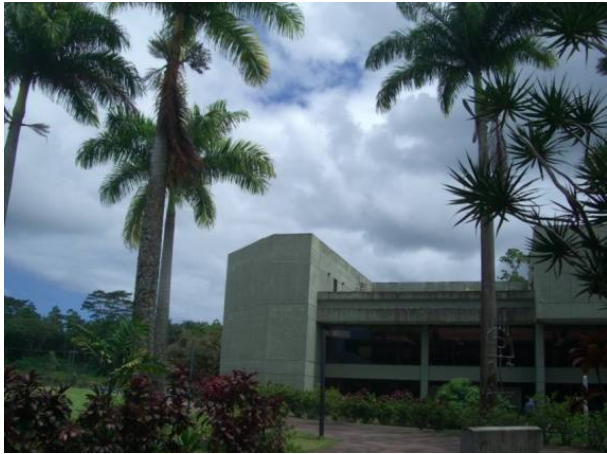
カフェテリアの前にて