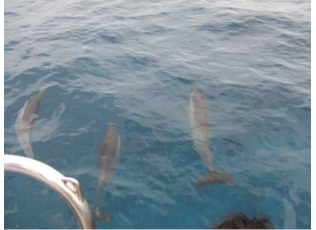
クラスで行ったイルカツアー