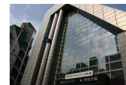
サテライトキャンパスひろしま