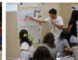
ポスターセッション