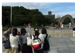
写真撮影実技指導