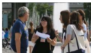
平和記念公園での取材