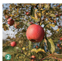
2 果樹園 Orchard