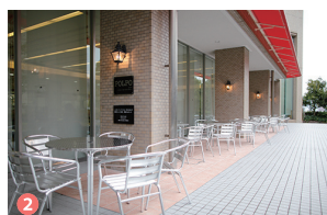
2 食堂 Cafeteria