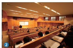
2 大講義室 Lecture room