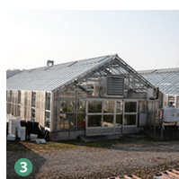
3 温室 Greenhouse