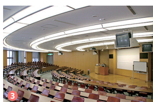
3 大講義室 Lecture room