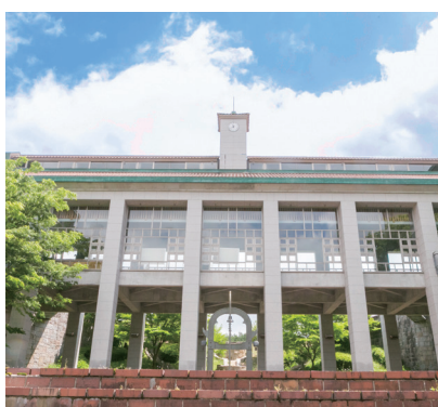
庄原キャンパス | Shobara Campus