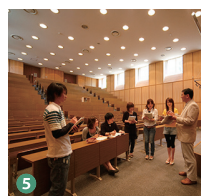
5 大講義室 Lecture room