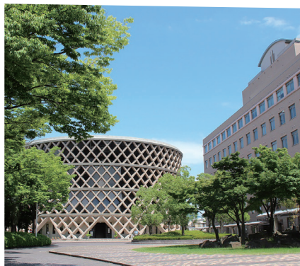
広島キャンパス | Hiroshima Campus

The Graduate School of Comprehensive Scientific Research consists of four Programs in Human Culture and Science, Information and Management Systems, Biological System Sciences, and Health and Welfare.