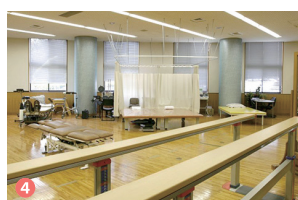
4 附属診療センター（理学療法室・作業療法室） Attached clinic center (Physical therapy room / occupational therapy room)