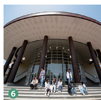
6 体育館兼講堂 Gymnasium and auditorium