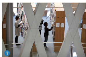
1 学術情報センター（図書館） Academic Information Center (Library)

県立広島大学は、「地域に根ざし、世界に通用する」大学院を目指して、 広島、庄原、三原の3キャンパスそれぞれが充実した教育設備を誇り、学修に集中できる環境を整えています。