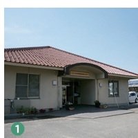
1 フィールド科学教育研究センター Field science Educational Research Center