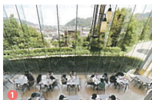
1 喫茶コーナー Tea room

◀積極的に外国人留学生を 受け入れています Accepting foreign students