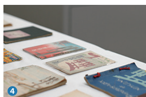
4 宮島学センター Miyajima studies center