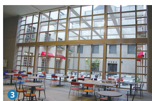
3 Cafe SHION