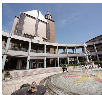
三原キャンパス | Mihara Campus