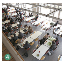
4 食堂 Cafeteria