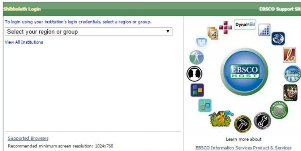
図 2 所属機関の選択

プルダウンメニューから「Japanese Research and Education - GakuNin」を選択し、「県立広島大学」をクリックします。