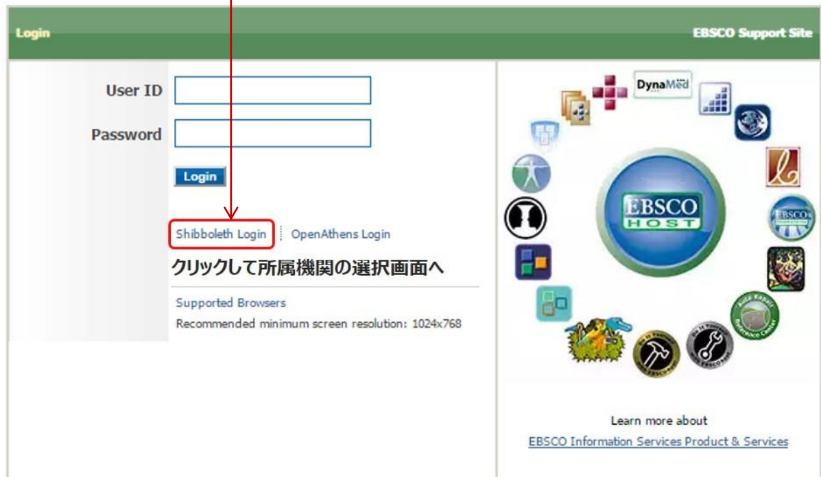
図1 ログインの実行

Important User Information: Remote access to EBSCO's databases is permitted to patrons of subscribing institutions accessing from remote locations for personal, non-commercial use. However, remote access to EBSCO's databases from non-subscribing institutions is not allowed if the purpose of the use is for commercial gain through cost reduction or avoidance for a non-subscribing institution.