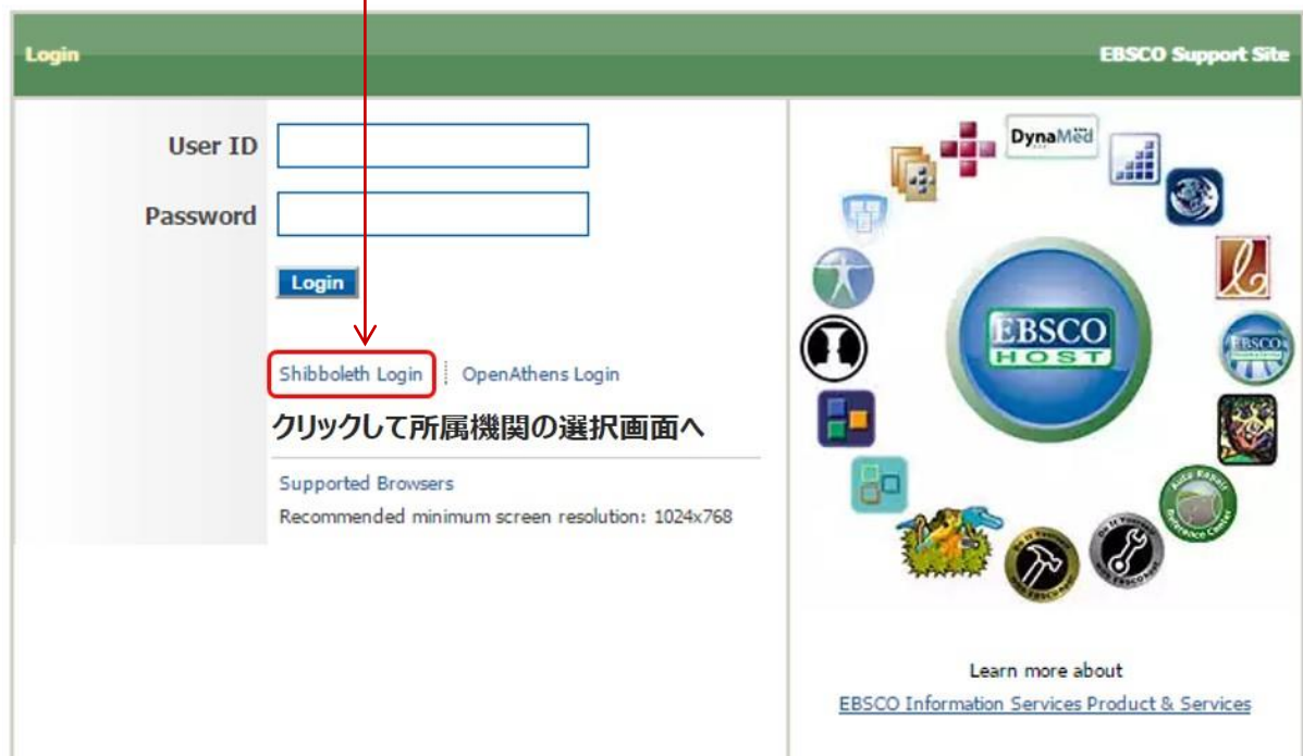
図1 ログインの実行

Important User Information: Remote access to EBSCO's databases is permitted to patrons of subscribing institutions accessing from remote locations for personal, non-commercial use. However, remote access to EBSCO's databases from non-subscribing institutions is not allowed if the purpose of the use is for commercial gain through cost reduction or avoidance for a non-subscribing institution.