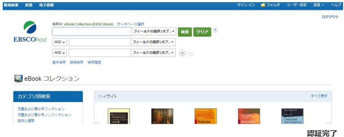
図 5 ポータルサイトの表示画面

認証が完了すると、NetLibrary eBook Collection のポータルサイトが起動します。そのまま本文の検索、閲覧、ダウンロードなどのサービスを利用できます。