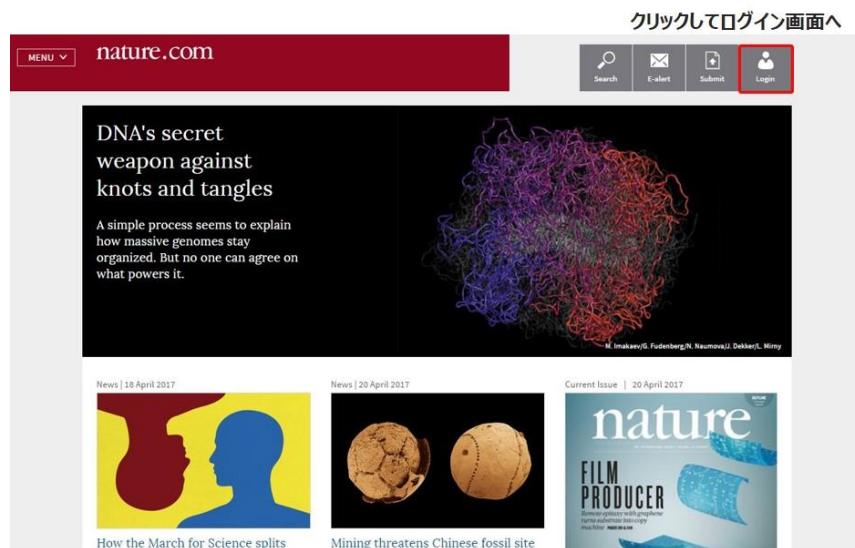
図1 ログインの実行

インターネットエクスプローラ等の Web ブラウザを使って、Nature のホームページへアクセスし、画面右上の「Login」をクリックします。