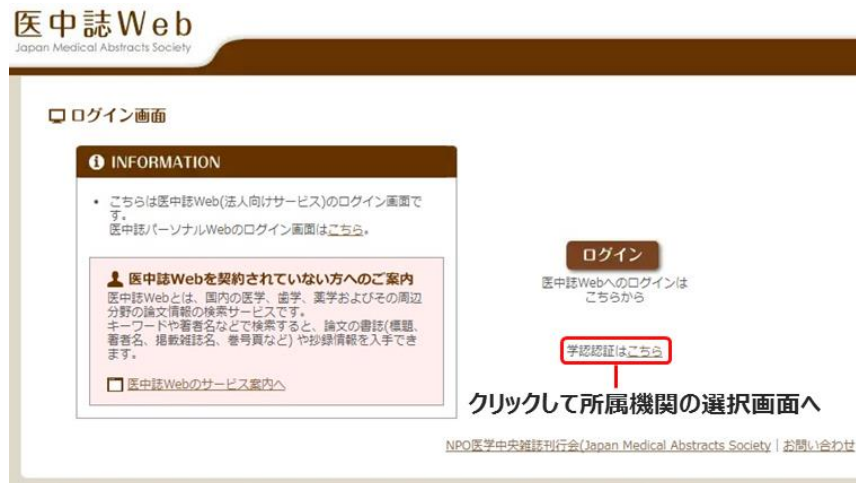
図1 ログインの実行

インターネットエクスプローラ等の Web ブラウザを使って、医中誌のホームページへアクセスし、画面右下の「学認認証はこちら」をクリックします。