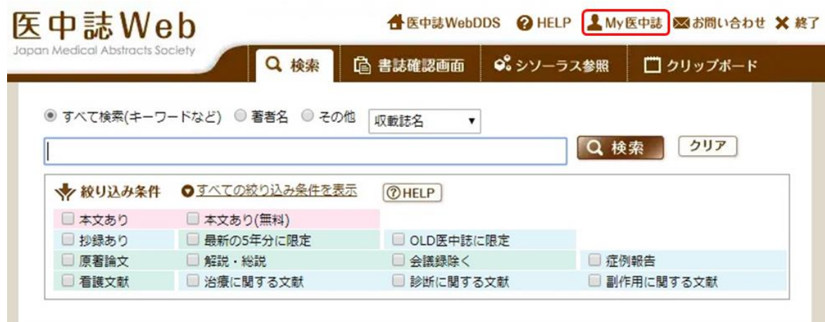
図5 ポータルサイトの表示画面

認証が完了すると、医中誌のポータルサイトが起動し、画面右上に「My 医中誌」と表示されます。