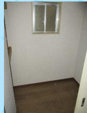
倉庫 (洋室タイプ専用)