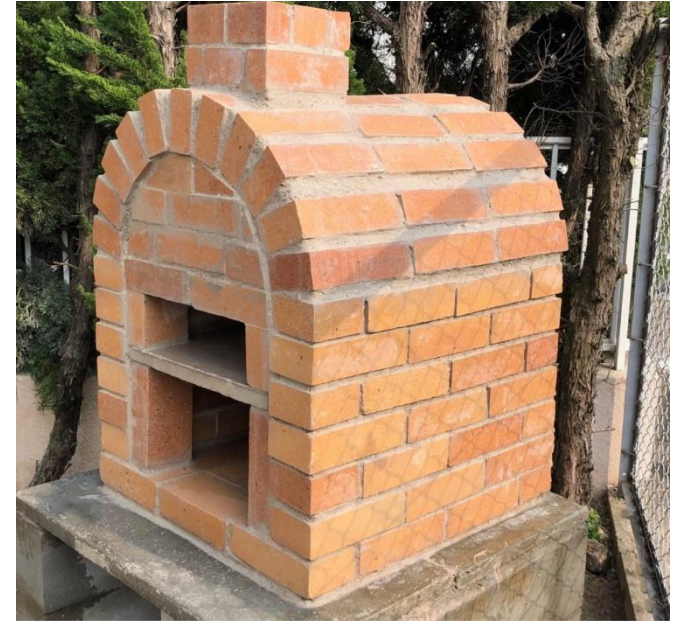
ピザ窯完成予定図