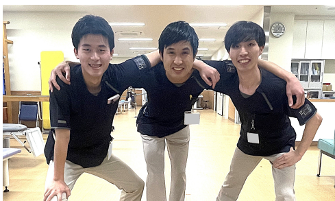
香川大学医学部附属病院