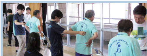
地域のニーズに根差した実践的な学修機会の提供

実践的で充実した学修環境を有し、地域課題に取り組む本学だからこそできる高度な専門知識と技術に基づいた実践が可能な次世代の理学療法士を育てます。本学には大学院博士課程前期・後期も併設しているため、在学中の各ゼミでの研究に加え、卒業後に大学院へ進学してさらなる理学療法の専門性を高める学びの提供も可能です。