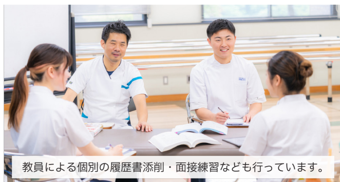
教員による個別の履歴書添削・面接練習なども行っています。

1年次からキャリア科目を開講し公務員対策講座やOB・OG就職ガイダンスなど充実したキャリアサポート体制を整えています。例年9割以上が1～2希望に就職し、また半数以上が公的病院(県・市職員・県病院・市民病院・大学病院など)へ就職しています。