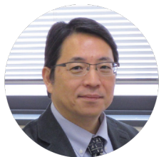
田中 聡 教授