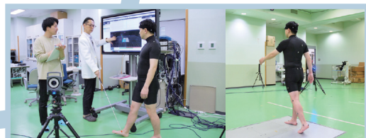
夜間・休日開講等の卒業後働きながら学べる大学院での専門性の探究