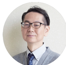
金井 秀作 教授