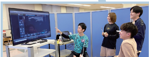
最新の機器・設備を駆使した高度医療に関する学修