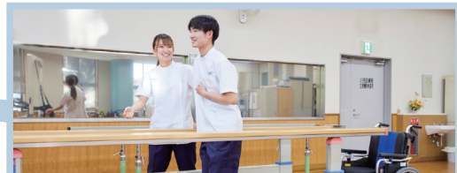
附属診療センターを使用した学内臨床教育の充実